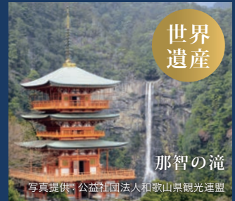
新宮・熊野 [和歌山]