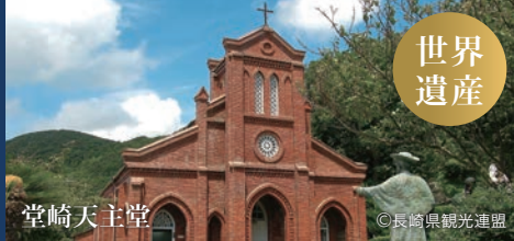
福江 五島列島 [鹿児島]