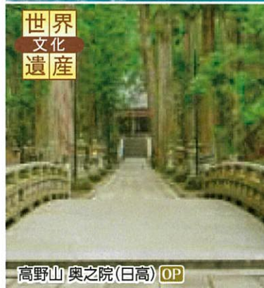
高野山 奥之院(日高) OP