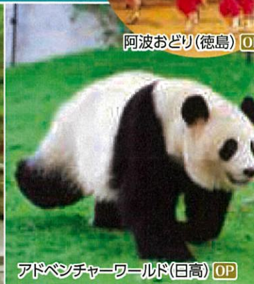
アドベンチャーワールド(日高) OP