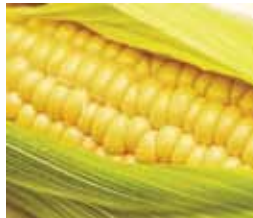
とうもろこし(イメージ)