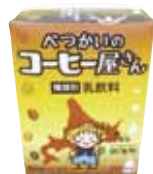
べつかいのコーヒー屋さん (イメージ)