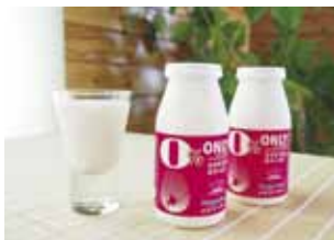
ラ・レトリの飲むヨーグルト(イメージ)

知床半島を航行中、7階ホライズンラウンジで「知床Café」をOPENします。人気店ラ・レトリなかしべつの飲むヨーグルト、羅臼昆布茶など地元のお飲物で満喫ください。