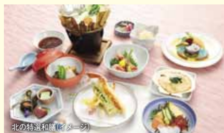
北の特選和膳(イメージ)