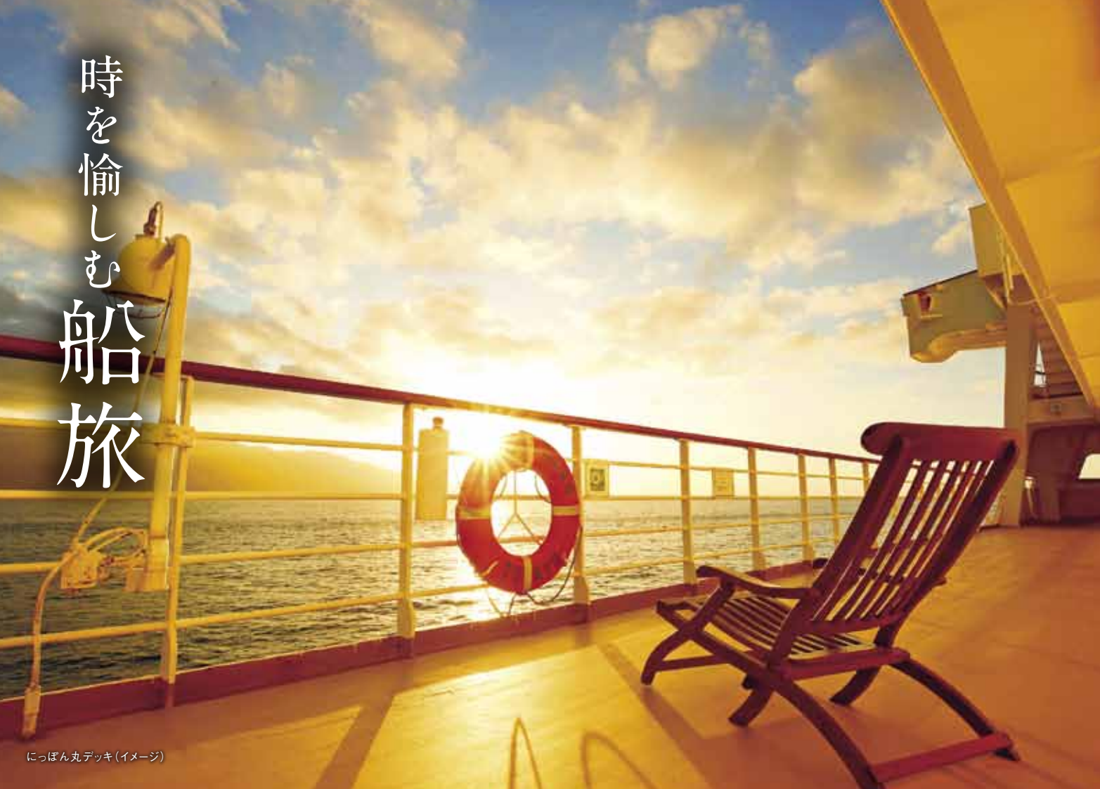
にっぽん丸デッキ(イメージ)