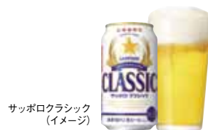
サッポロクラシック (イメージ)

7階リドテラスでは農家から直送されたあま〜いとうもろこし「恵味ゴールド」と北海道限定のビール「サッポロクラシック」をご賞味いただけます。北海道の夏の旬をお楽しみください。