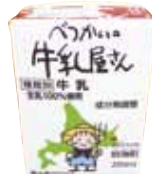
べつかいの牛乳屋さん (イメージ)

羅臼港では、にっぽん丸のお客様だけの「羅臼テラス」が設置されます。雄大なオホーツク海を眺めながらべつかいコーヒー、べつかい牛乳をご堪能ください。