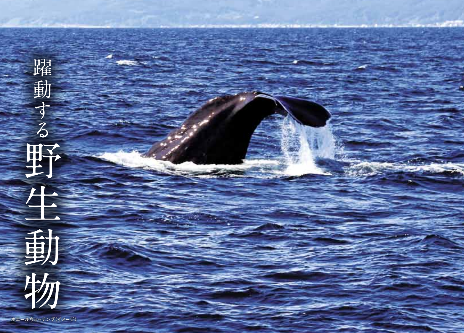
ホエールウォッチング(イメージ)