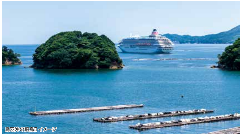
鳥羽沖の飛鳥IIイメージ

ミドルエイジ 10% 40~50歳代のお客様は旅行代金が 10%割引 になります。 ※ご本人様に限ります。 ※対象：①8月13日発:1961年8月14日~1981年8月15日生まれ。 ②8月28日発:1961年8月29日~1981年8月30日生まれ。 ③9月10日発:1961年9月11日~1981年9月12日生まれ。