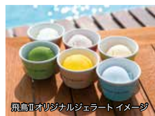
飛鳥IIオリジナルジェラートイメージ